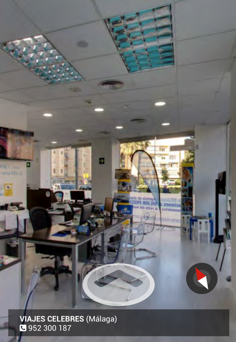
VIAJES CELEBRES (Málaga) ☎ 952 300 187